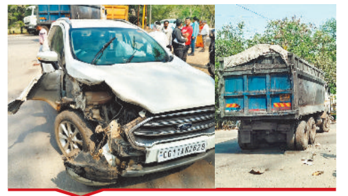
सिरगिट्टी में टुक के पीछे घुसी कार