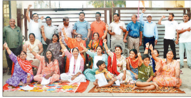
अटल आवास के लिए रास्ता देने के विरोध में प्रदर्शन करते कॉलोनीवासी।

तक निगम द्वारा अटल आवास के लिए पृथक मार्ग, पानी, नाली और बिजली की व्यवस्था नहीं की जाती, तब तक कॉलोनी के भीतर से आवागमन की अनुमति नहीं दी जाएगी। रहवासियों का कहना है कि यदि बीच कालोनी से रास्ता दिया गया तो परिव्य में सुरक्षा और अव्यवस्था की स्थिति बन सकती है, जिससे विवाद की आशंका रहेगी। कॉलोनीवाइजर-बिल्डर पर वादा खिलाफी का आरोप लगाते हुए यहां के लोग कालोनी के मुख्य प्रवेश द्वार पर धरने पर बैठ गए। आरोप है कि बिल्डर ने सरकारी जमीन को निजी बताकर बेचा है। धरने में बड़ी संख्या में महिलाओं की उपस्थिति रही। रहवासियों ने बताया कि ड्रीम इनवलेव एक पूर्ण विकसित कॉलोनी है, जिसे नगर निगम द्वारा पूर्णत